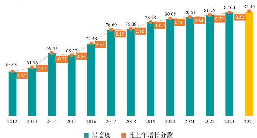
图 3 2012—2024 年全国知识产权保护社会满意度

知识产权普惠服务日益优化。 推进知识产权公共服务标准化规范化便利化，在全国 34 个城市开展知识产权公共服务标准化建设试点。编制出台知识产权政务服务事项办事指南，推动 72 项服务事项全国同标准办理。持续提升知识产权登记和审查质效，2024 年，全国著作权登记总量近 1063.1 万件，同比增长 19.1%，发明专利平均审查周期压减至 15.5 个月，审查结案准确率达到 95.2%，达到相同审查制度下的国际先进水平。